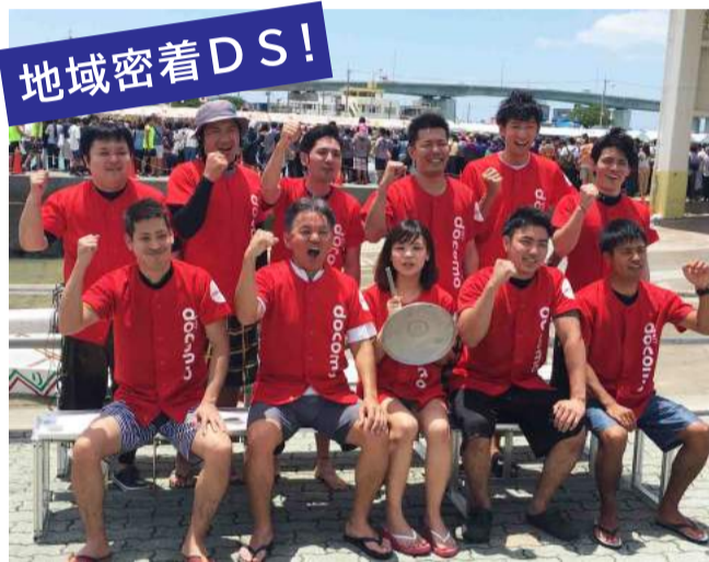
結果はタイム4分41秒で3位 前回より20秒縮める事ができました。

去る五月二十九日に毎年恒例の糸満ハーレーが行われました。参加した糸満店からコメントを頂きましたので紹介します。「皆様、糸満ハーレーへのご協力ありがとうございました。皆様の協力もあり今年もトラブルなく無事に終了しました。昨年よりタイムも縮めることができ、来年は更にタイムを縮めてよりよい結果が残せるよう練習がんばります。」